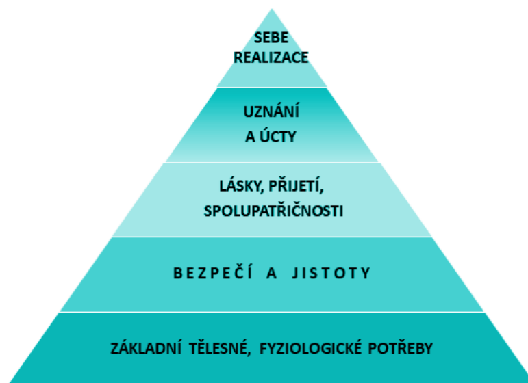
Obr. 1: Hierarchie lidských potřeb podle A. Maslowa 2

Výzkumy Maslowovy pyramidy potřeb ukazují, že u dětí nemusí nutně být uspokojování vyšších potřeb předchozím naplněním nižších potřeb, ale jde často o současné prolínání naplňování potřeb ve smyslu hledání efektivní cesty vlastního rozvoje s minimální ztrátou času života. To otevírá prostor pro další poznání a při práci s potřebami v pedagogice. Vycházíme přitom z podrobného přehledu lidských potřeb tak, jak je definuje Marshall Rosenberg. 3